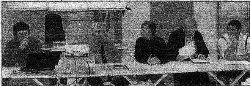
Les membres du comité directeur lors de cette assemblée générale.